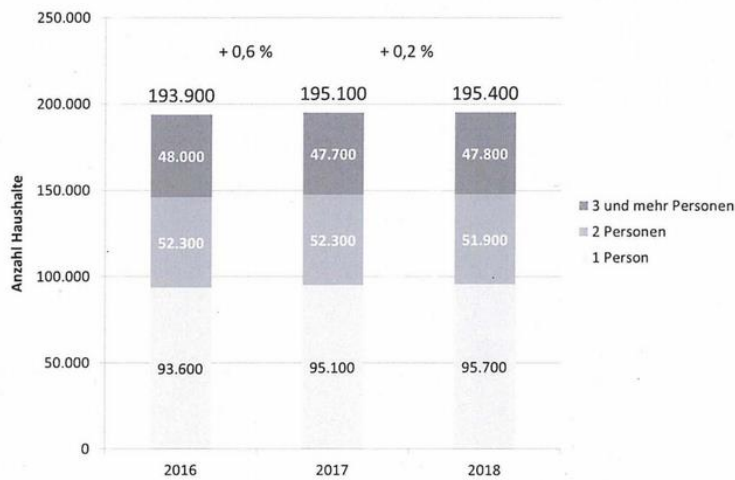
Abbildung 5: Haushaltsentwicklung in Bochum, 2016 - 2018

Quelle: eigene Darstellung nach Daten der Stadt Bochum